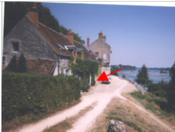
Vue du site BDHE 156 point de repère 204