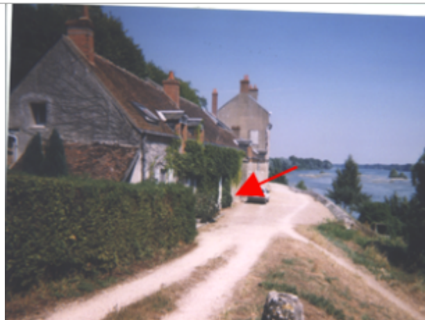
Vue du site BDHE 156 point de repère 204

Coordonnées WGS84 : X: 1.72724646 / Y: 47.84439870