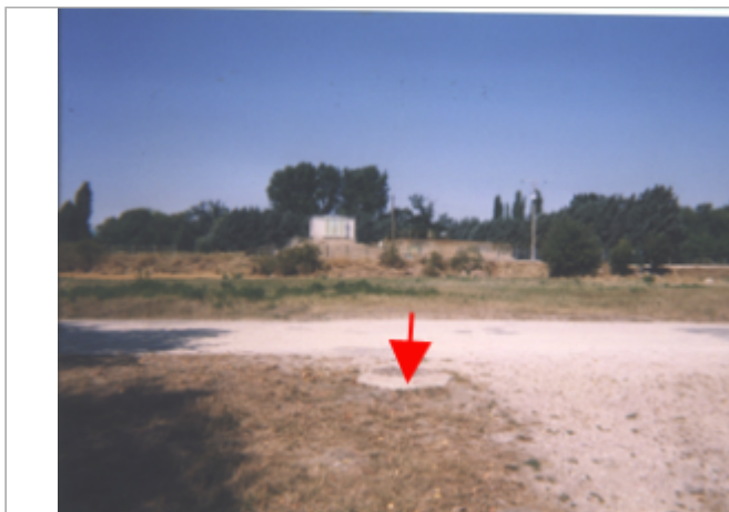
Vue du site BDHE 155 point de repère 203