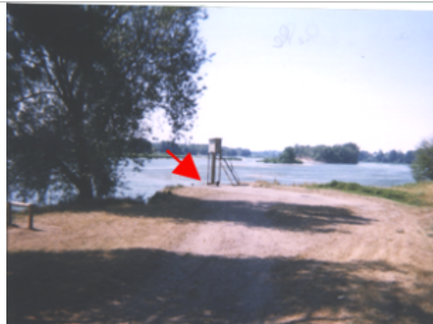
Vue du site BDHE 153 point de repère 200