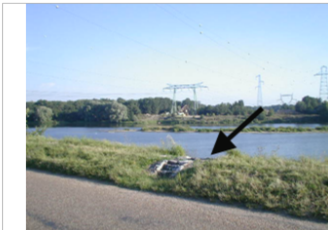
Vue du site BDHE 152 point de repère 199