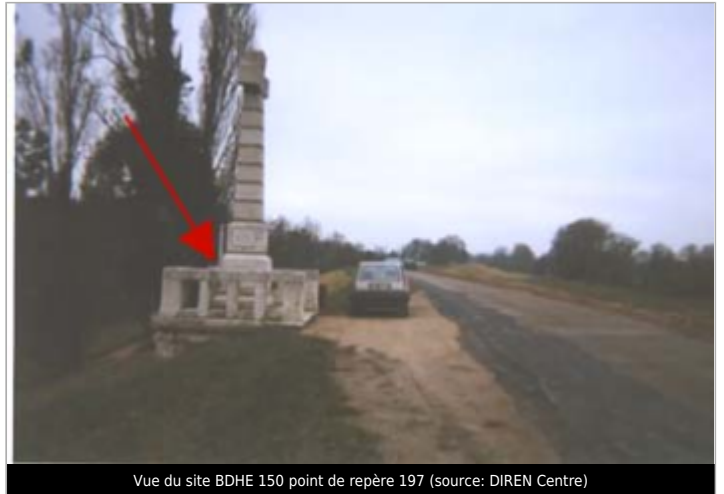
Vue du site BDHE 150 point de repère 197

Coordonnées WGS84 : X: 1.83995350 / Y: 47.88095890