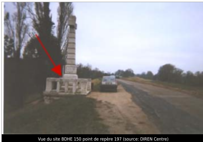
Vue du site BDHE 150 point de repère 197