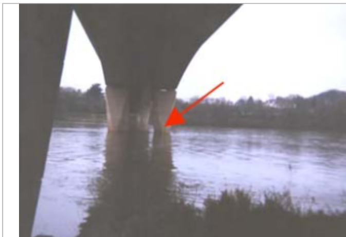
Vue du site BDHE 148 point de repère 194

Coordonnées WGS84 : X: 1.85755221 / Y: 47.89071720