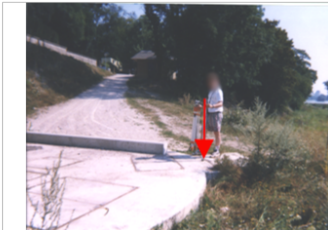
Vue du site BDHE 147 point de repère 469

Coordonnées WGS84 : X: 1.86151507 / Y: 47.89438300