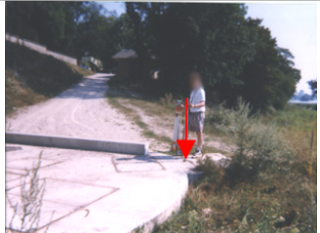
Vue du site BDHE 147 point de repère 469

Coordonnées WGS84 : X: 1.86151507 / Y: 47.89438300