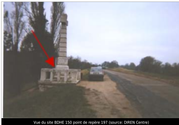
Vue du site BDHE 150 point de repère 197