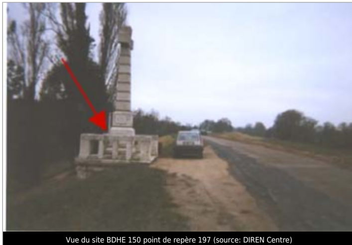
Vue du site BDHE 150 point de repère 197