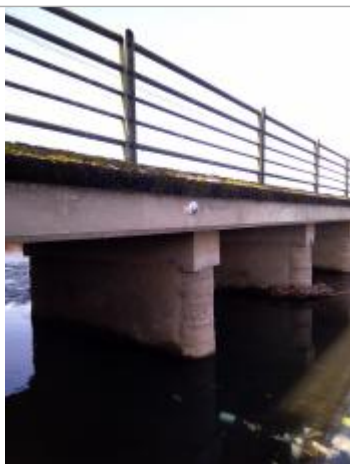
Vue du repère - Auteur : SMBGP