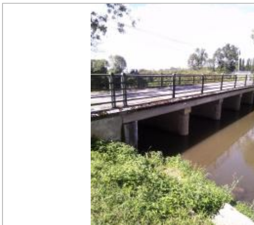
Vue du site - Auteur : SMBGP

Coordonnées WGS84 : X: -0.20156421 / Y: 43.26233480