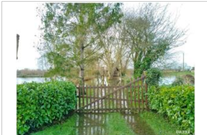
Vue depuis la rue de la Passerelle.