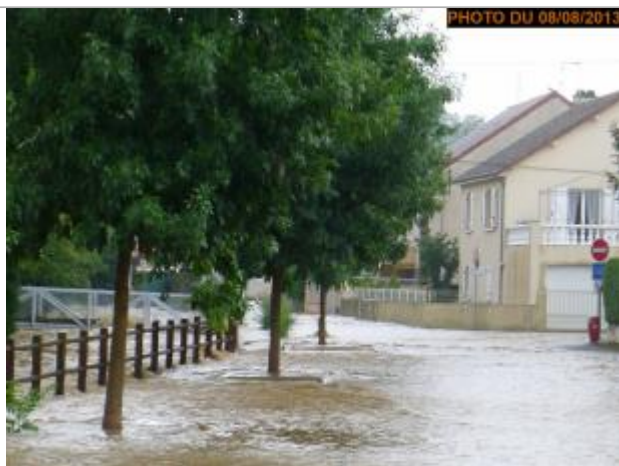
Vue de la photo en 2013

Altitude calculée de l'eau (en m) : 269.853