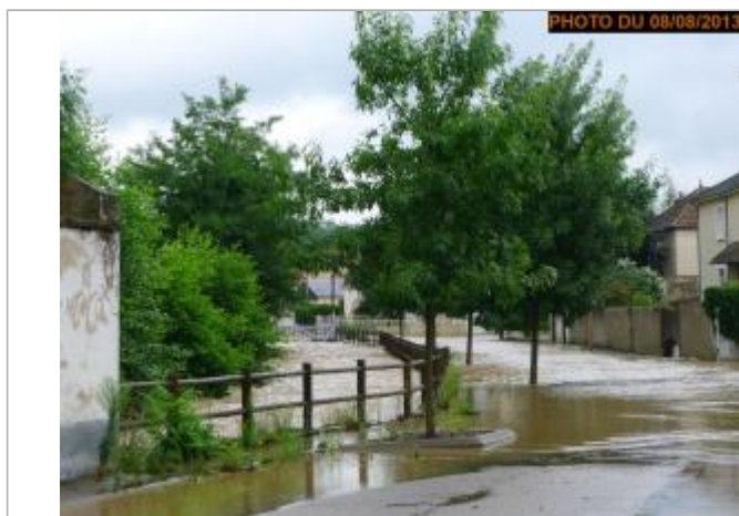
Vue de la photo en 2013

Altitude calculée de l'eau (en m) : 269.83