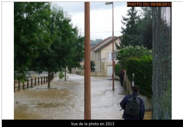
Vue de la photo en 2013

SOURCE DE REPÉRAGE : SPC LACI, CAMPAGNE DE RECENSEMENT 2023 - 12/06/2023