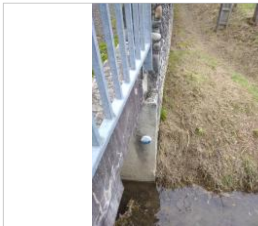
Vue du repère - Auteur : SMBGP