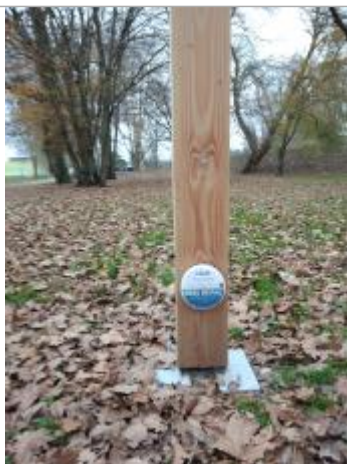
Vue du repère - Auteur : SMBGP