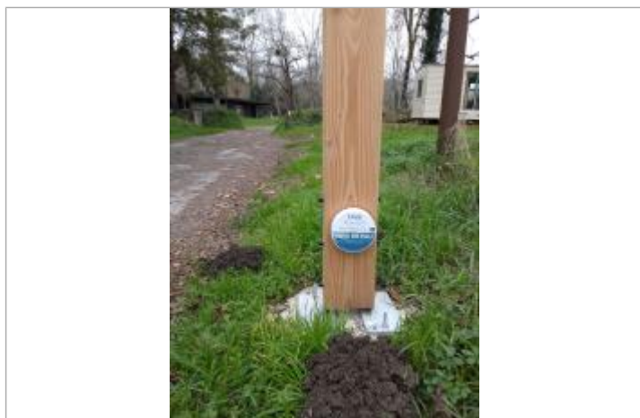
Vue du repère - Auteur : SMBGP