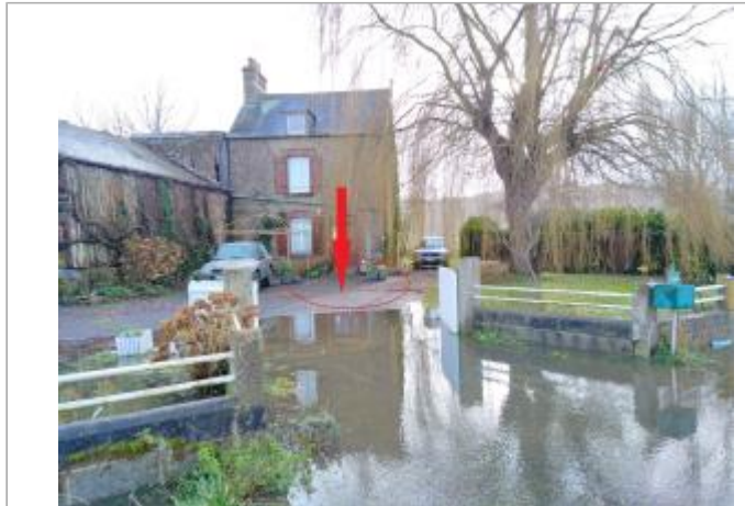
vue de la RD 31

Coordonnées WGS84 : X: -1.36518370 / Y: 48.69623870