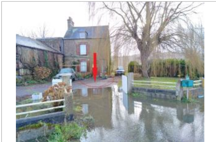
vue de la RD 31