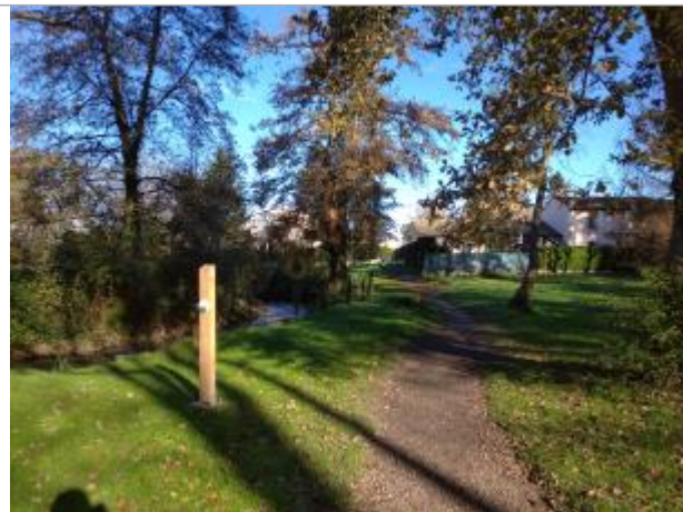
Vue du site - Auteur : SMBGP

Coordonnées WGS84 : X: -0.36211037 / Y: 43.32649130