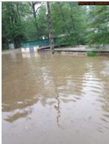
Vue de la photo en 2012

Altitude calculée de l'eau (en m) : 276.751 m