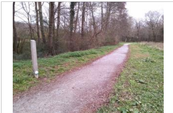
Vue du site - Auteur : SMBGP