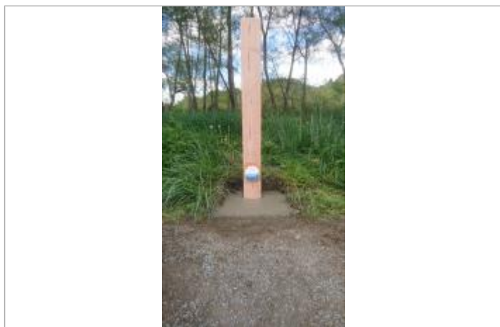
Vue du repère - Auteur : SMBGP 2023

Altitude calculée de l'eau (en m) : 105.52 m