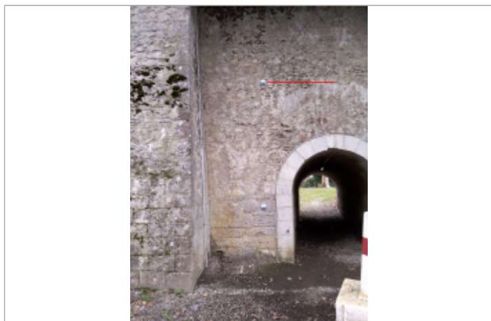
Vue du repère (le trait rouge représente la hauteur d'eau) - Auteur : SMBGP

Altitude calculée de l'eau (en m) : 61.29 m