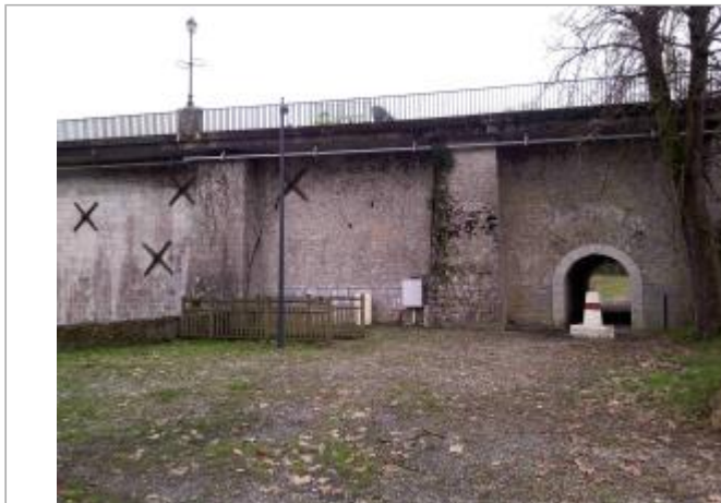
Vue du site depuis l'aval