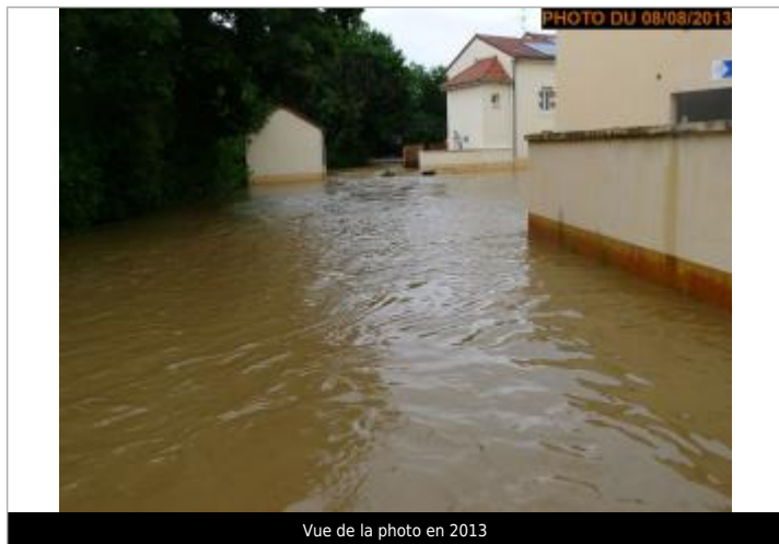
Vue de la photo en 2013

Altitude calculée de l'eau (en m) : 319.4