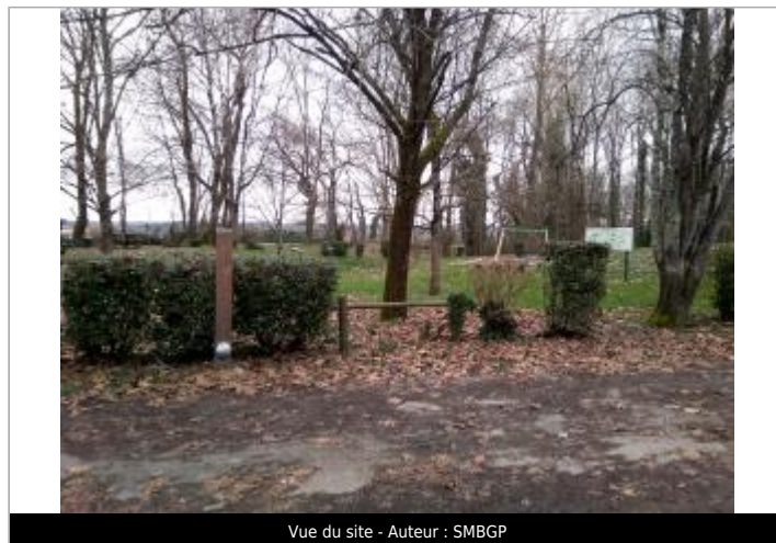
Vue du site - Auteur : SMBGP