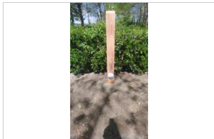
Vue du repère - Auteur : SMBGP