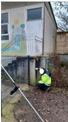
Vue depuis la berge de la Sée

Altitude calculée de l'eau (en m) : 9.74 m