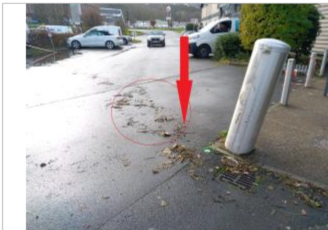
Vue depuis le parking