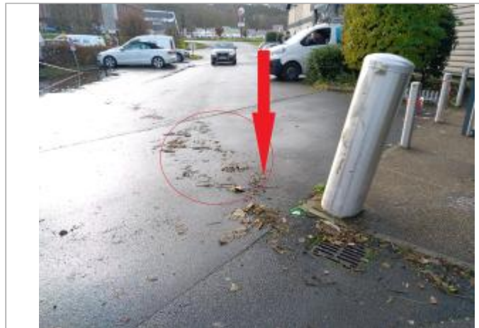
Vue depuis le parking

Coordonnées WGS84 : X: -1.36752961 / Y: 48.69168910