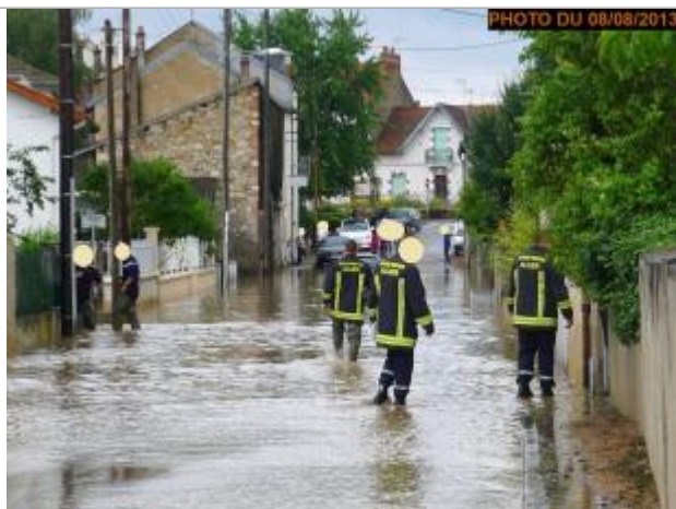
Vue de la photo en 2013

Altitude calculée de l'eau (en m) : 272.89