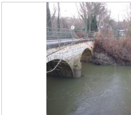
Vue de la marque

SOURCE DE REPÉRAGE : SPC SMYL - 21/01/2020