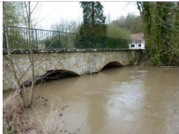
Crue du 1er Juin 2016

Coordonnées WGS84 : X: 3.17723000 / Y: 48.90955000