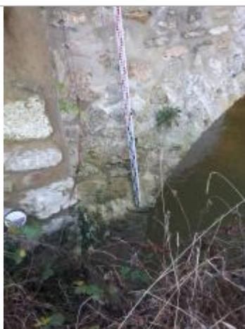
Vue de la marque

SOURCE DE REPÉRAGE : SPC SMYL - 21/01/2020