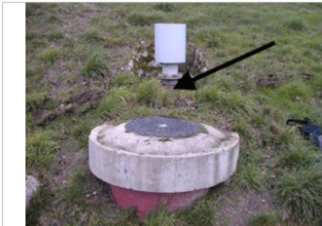
Vue du site BDHE 145 point de repère 503