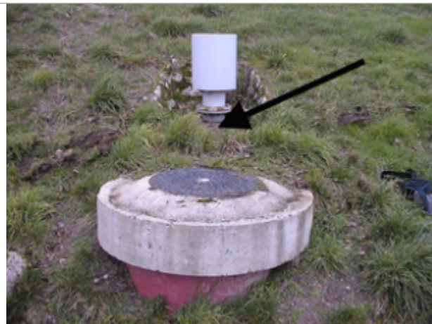
Vue du site BDHE 145 point de repère 503