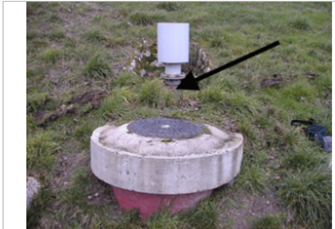
Vue du site BDHE 145 point de repère 503

Coordonnées WGS84 : X: 1.88409170 / Y: 47.89760590