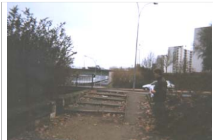
Vue du site BDHE 143 point de repère 188