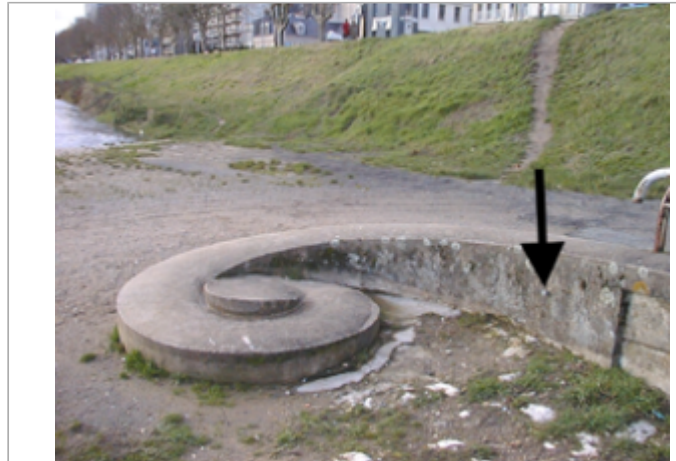
Vue du site BDHE 142 point de repère 596

Coordonnées WGS84 : X: 1.89393166 / Y: 47.89747400