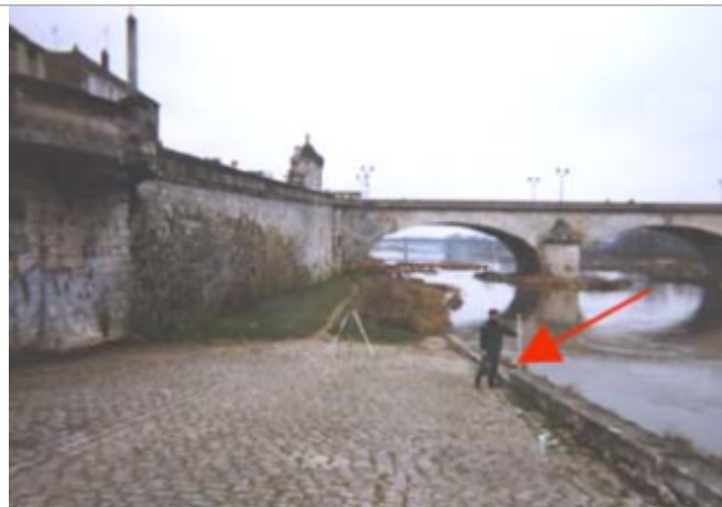
Vue du site BDHE 138 point de repère 502