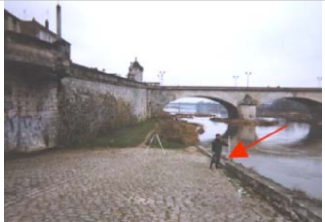
Vue du site BDHE 138 point de repère 502