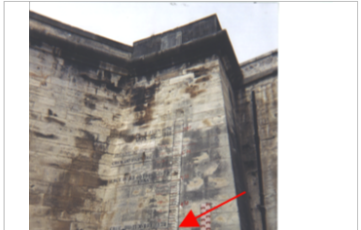
Vue du site BDHE 137 point de repère 178