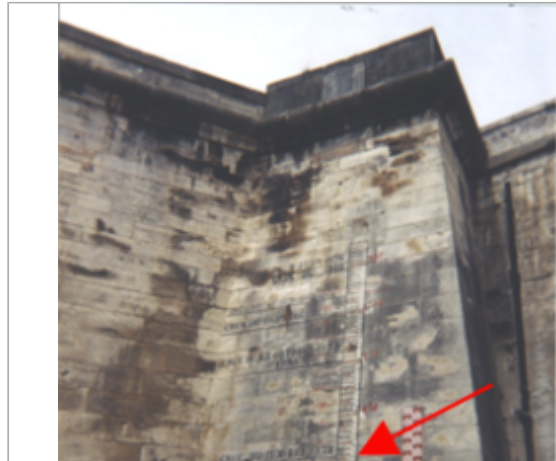
Vue du site BDHE 137 point de repère 178

Coordonnées WGS84 : X: 1.90450960 / Y: 47.89789720