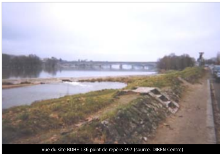
Vue du site BDHE 136 point de repère 497