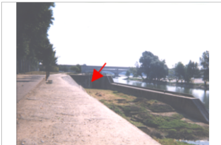
Vue du site BDHE 134 point de repère 174