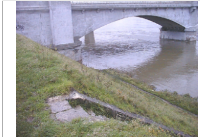
Vue du site BDHE 130 point de repère 422