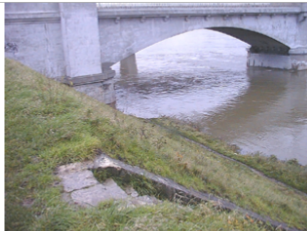
Vue du site BDHE 130 point de repère 422