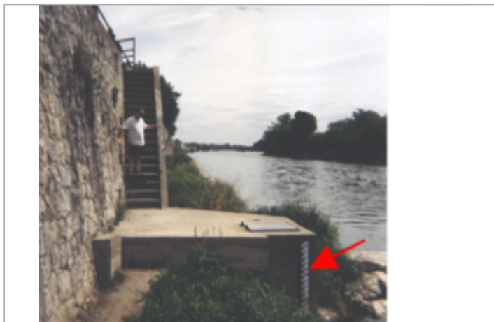
Vue du site BDHE 129 point de repère 170