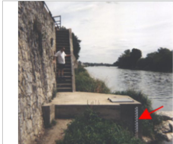
Vue du site BDHE 129 point de repère 170

Coordonnées WGS84 : X: 1.92760172 / Y: 47.89964950