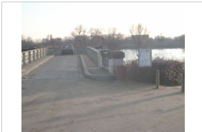
Vue du site BDHE 127 point de repère 168