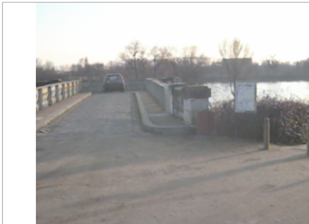
Vue du site BDHE 127 point de repère 168