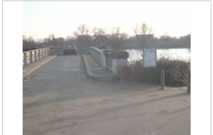
Vue du site BDHE 127 point de repère 168