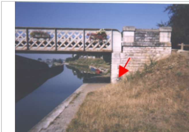
Vue du site BDHE 126 point de repère 165