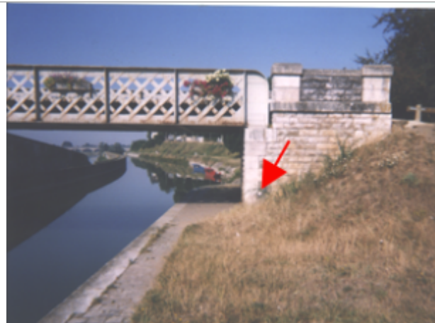
Vue du site BDHE 126 point de repère 165