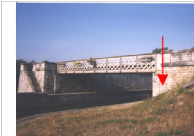
Vue du site BDHE 123 point de repère 162

Coordonnées WGS84 : X: 1.96242598 / Y: 47.90316650